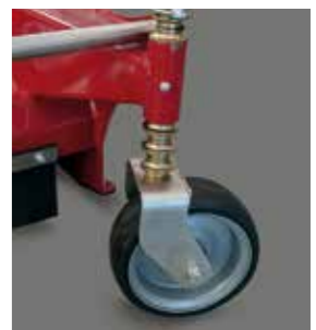
Regolazione altezza ruote Height adjustment wheels Höhenverstellung Räder Ruedas de ajuste de altura Molletoes de réglage de la hauteur