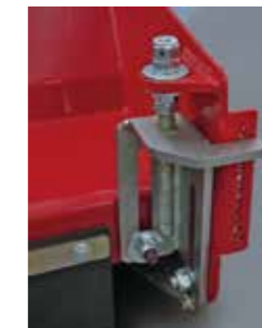
Regolazione altezza taglio Cutting height adjustment Schnitthöhenverstellung Ajuste de altura de corte Réglage hauteur de coupe