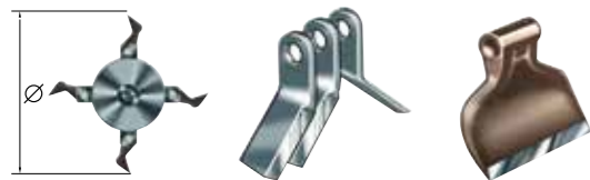
Ø 315 mm Type Y Type M81